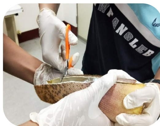
二、把筍殼做成圓筒狀