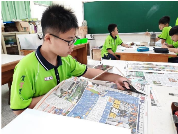
△多文本閱讀與剪報