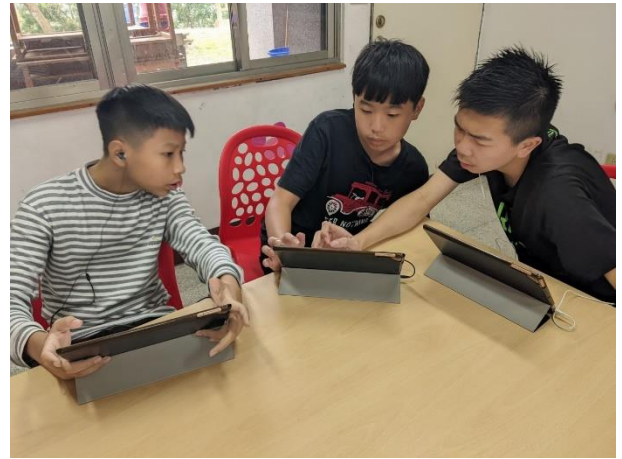
△運用數位閱讀融入學習是趨勢