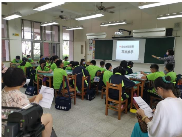
△讀到科普文本中的關鍵字詞