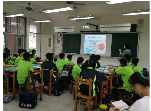
△教師引導學生從多文本進行主題閱讀和探索