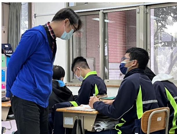
△透過提問，促進閱讀之思考與理解