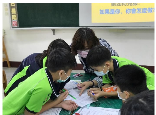
△小組討論，找證據支持觀點