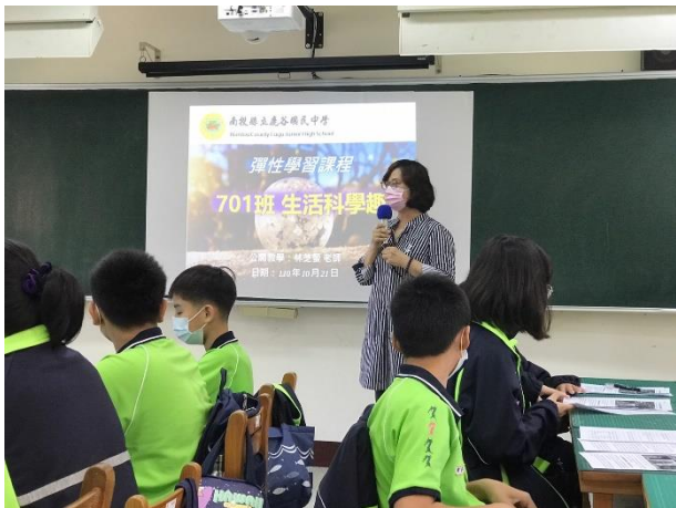
△老師說明生活中科普多文本閱讀