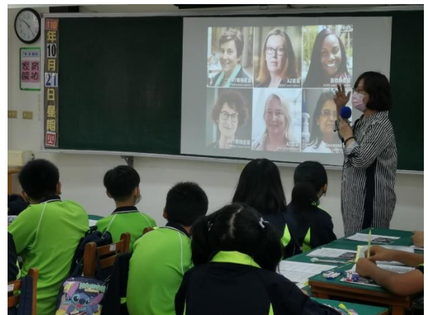
△文字與圖像的連結，引發關注和理解