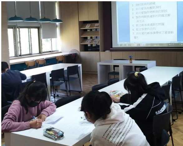
△讀到科普文本中的關鍵字詞