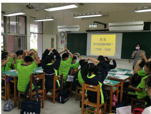
△透過提問，促進閱讀理解之思考與表達