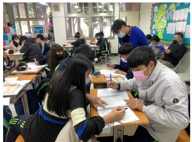
△小組討論，找證據支持觀點