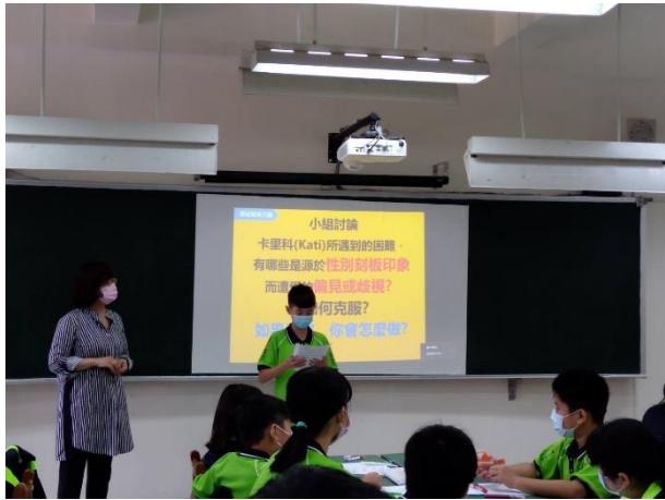
△學生上台發表問題討論的結果