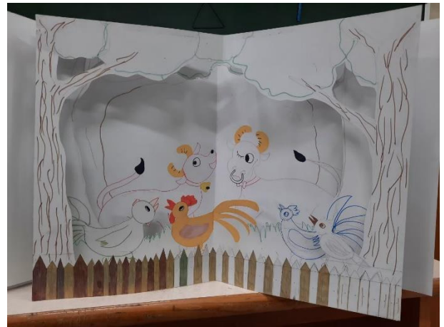
△文字與圖像的連結，引發關注和理解