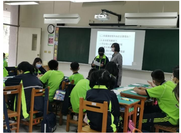
△仔細聆聽分享，補充說明不同觀點