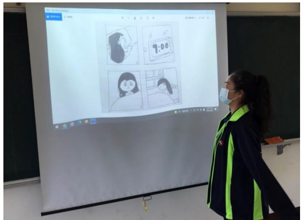
△以四格漫畫表達對段落的理解