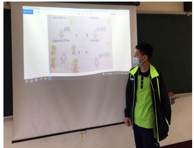
△以圖文說明對文本事實的理解