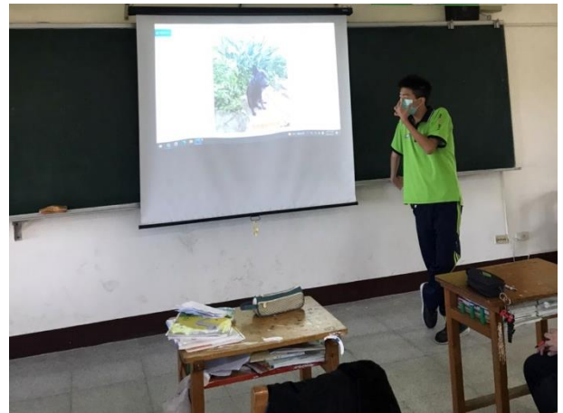
△以一個圖像表達對文字意象的理解