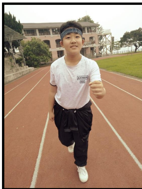
(圖為將褲頭鬆緊帶改為運動用頭帶)

升上國中，書包愈來愈重，背著裝有書籍與功課的沉重書包，雖然公車站距離我們國中不是特別遠，但是三公斤的書包還是會讓我們感到疲累。我們為什麼要讓書包成為放學時的小壓力呢？讓舊衣變成包包吧！舊衣服你會怎麼處理呢？是直接拋棄？還是舊衣回收？現在有一個辦法，我們可以把舊衣服改造成自己喜歡的包包或可愛的手作小物。用舊衣服來做小飾品，簡單又方便，既可以把衣服處理掉也可以變時尚。但如果做的成品不好看，這也是個問題。如果衣服的顏色不好看，做的背包自然也不好看，所以我們要選擇顏色比較亮麗的，這樣才會顯得時尚又美觀。